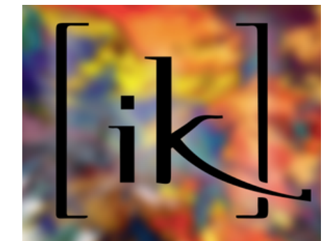
Journal étudiant de Polytechnique