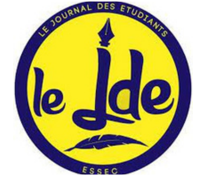
Journal des étudiants de l'ESSEC