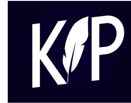
Média étudiant HEC - Paris